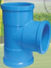
Tee Inyectado Ø 20 mm a 315 mm.